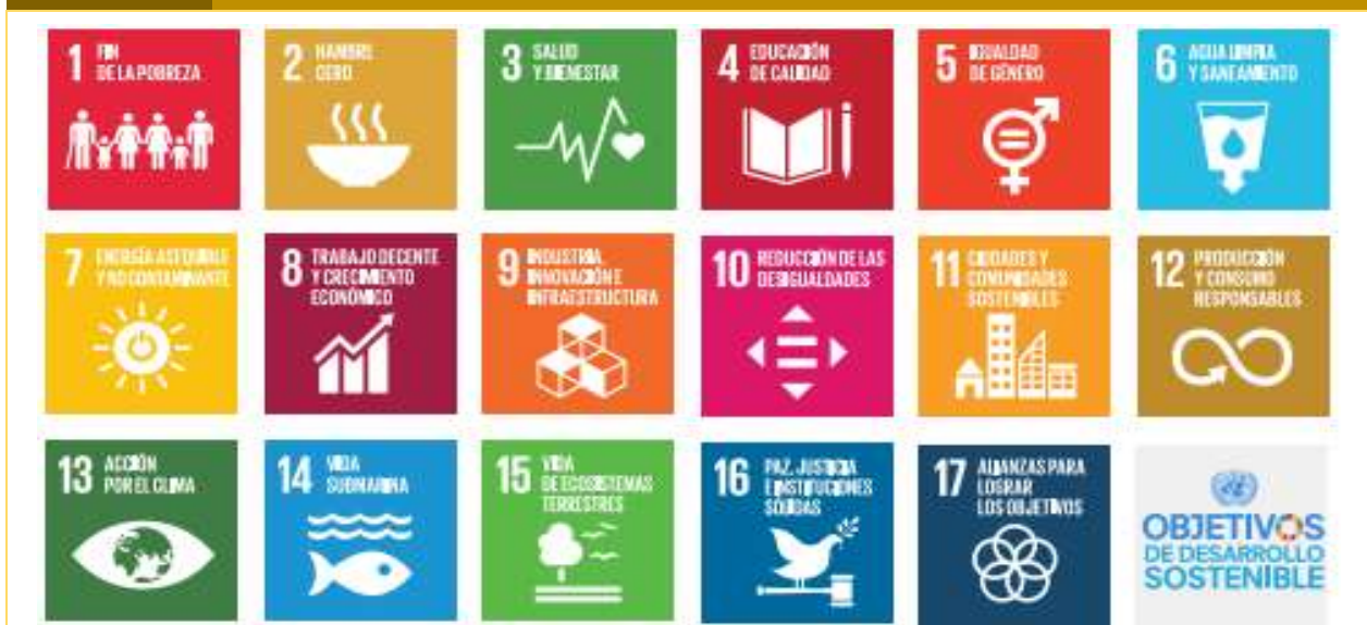
Figura 1.2 Objetivos de Desarrollo Sostenible (ODS) 2015-2030

Fuente: Naciones Unidas. Objetivos de Desarrollo Sostenible. Disponible en: http://www.un.org/sustainabledevelopment/es/objetivos-de-desarrollo-sostenible/