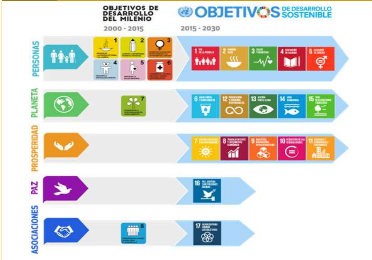
Figura 1.3 De los Objetivos de Desarrollo del Milenio a los Objetivos de Desarrollo Sostenible

Fuente: ONU-México. Objetivos de Desarrollo Sostenible. 2016. Disponible en: http://www.onu.org.mx/agenda-2030/objetivos-de-desarrollo-del-milenio/