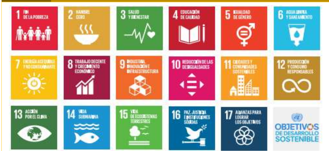
Figura 1.2 Objetivos de Desarrollo Sostenible (ODS) 2015-2030

Fuente: Naciones Unidas. Objetivos de Desarrollo Sostenible. Disponible en: http://www.un.org/sustainabledevelopment/es/objetivos-de-desarrollo-sostenible/