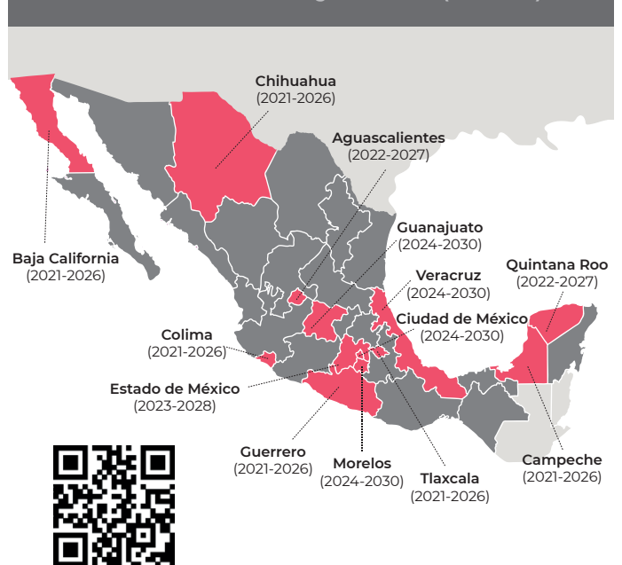
Entidades Federativas con gobernadoras (2021-2030)

Fuente: INMUJERES-DGPVLVIPP. (2024). Proceso Electoral Federal y Local 2023-2024. México.