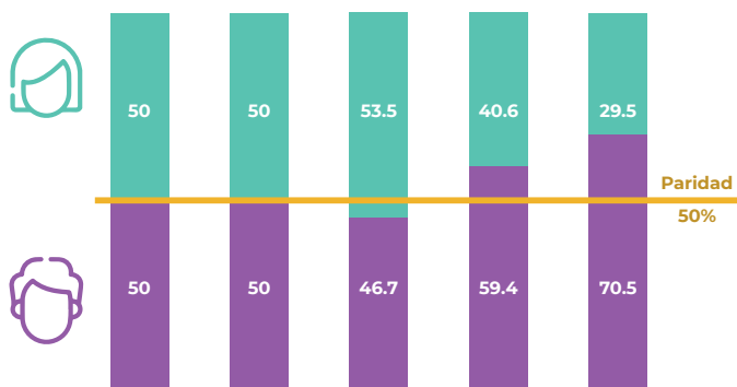
Integración de cargos de elección popular por sexo, comicios 2024 (selección)

En México, los datos muestran que la participación política de las mujeres ha aumentado significativamente, especialmente en la última década. Por ejemplo, en la Cámara de diputadas y diputados, la participación de las mujeres pasó de 16.8% en el 2000 al 50% en 2021 y 2024. Este progreso se debe a diversos factores, como las demandas de movimientos sociales y feministas, la implementación de cuotas de género en los noventa y las reformas constitucionales de 2014 y 2019 que establecieron y fortalecieron la paridad de género.