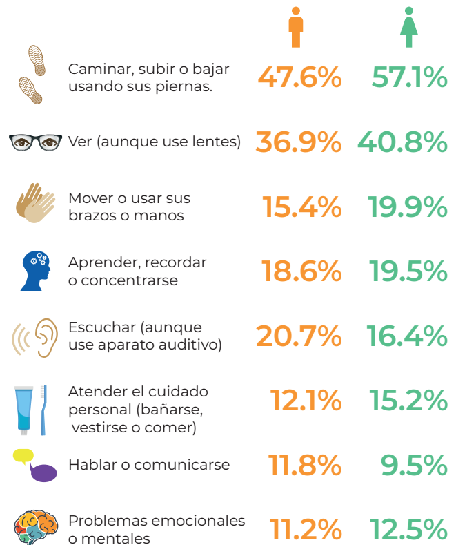
Porcentaje de población con discapacidad, por tipo de discapacidad, 2018

Nota: Una persona pudo reportar dificultad (discapacidad) en más de una actividad.