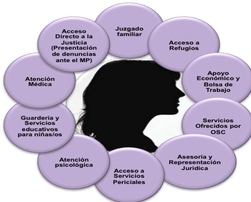
Diagrama 1: Plan Único de Apoyo

La concentración de servicios en un solo espacio, evitará que las víctimas tengan que acudir a múltiples instancias, lo cual conlleva una serie de dificultades que pueden disuadir las para buscar ayuda o continuar con los procesos. Por ejemplo, las mujeres deben invertir tiempo y dinero en los traslados de la procuraduría, a los juzgados, al Sistema para el Desarrollo Integral de la Familia (DIF) y/o a la guardería. 62