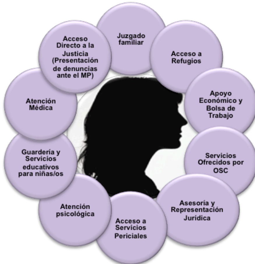
Diagrama 1: Plan Único de Apoyo

Las dependencias y organizaciones de la sociedad civil que se encuentren en el Centro deberán proveer a través de un "Plan Único de Apoyo" los servicios que requiera la víctima conforme a su nivel de riesgo.