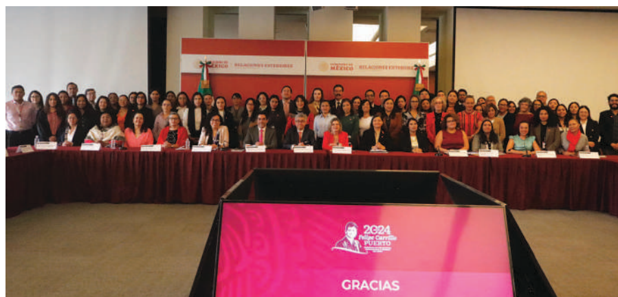
El CEDAW hace recuento de logros de la presente administración en favor de la igualdad de género.