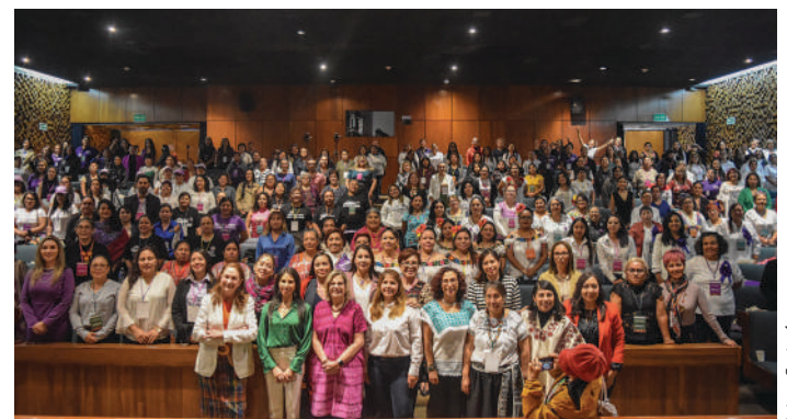
Las redes de mujeres constructoras de paz aportan al cambio cultural.

El diálogo reunió a más de 200 mujeres constructoras de paz y representantes de 26 entidades federativas para analizar el impacto de la estrategia Mucpaz en la reconstrucción del tejido social y su contribución a las políticas públicas de prevención de la violencia y cambio cultural.