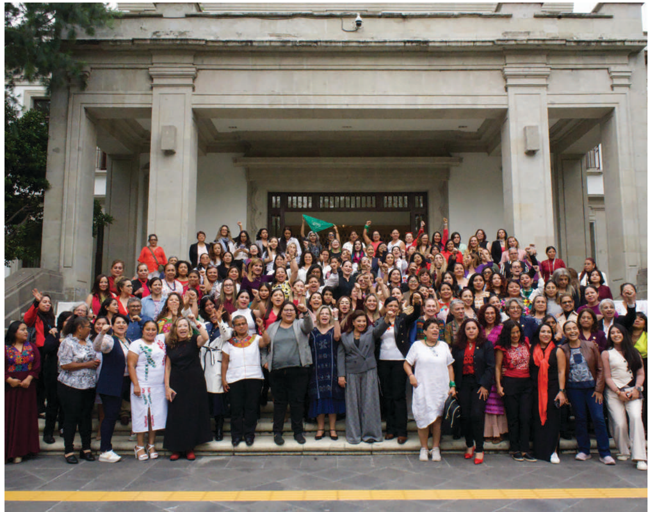
La unión de las mujeres ha dado fuerza al movimiento feminista que busca la igualdad para las mexicanas y los mexicanos.

Durante la inauguración de este encuentro, la presidenta del Inmujeres, Nadine Gasman Zylbermann, sostuvo que, al lado de la presidenta electa de México, Claudia Sheinbaum Pardo, habrá un mayor número de mujeres tomando decisiones importantes en las regidurías, en los municipios, en los estados y a nivel federal.