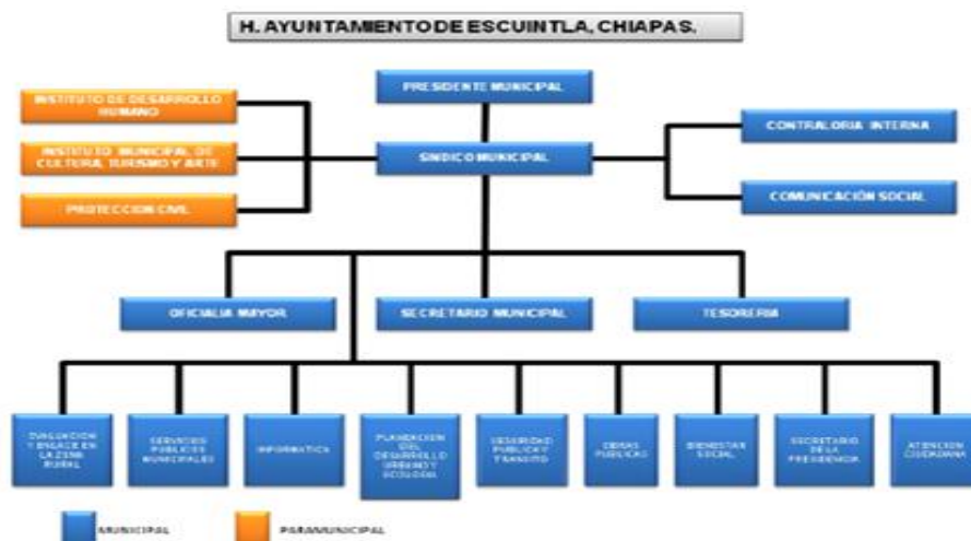
FIGURA (4) ORGANIGRAMA DEL MUNICIPIO DE ESCUINTLA, CHIAPAS.

La administración del ayuntamiento para su funcionamiento se organiza en áreas de gobierno, denominadas direcciones, subdirecciones y coordinaciones municipales, que pueden ser desempeñadas por el personal que contrata el ayuntamiento y que cumplan con el perfil para cubrir dicha tareas. La siguiente imagen es un organigrama del municipio de Escuintla