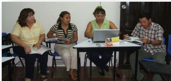
Grupo de Trabajo del Laboratorio de Lengua Maya del Instituto Campechano.

En dicho contexto en enero de 2007, se gestionó desde la Dirección de Planeación, el proyecto de Diseño Curricular por Competencias que incluyó una propuesta para la aplicación del enfoque de educación intercultural bilingüe para las escuelas de nivel superior que se vincularan con las lenguas indígenas.