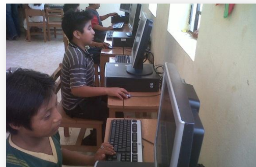
Equipo de Cómputo entregado en Escuelas Indígenas.

educación indígena en competencias lingüísticas, con sedes en Calkiní, Hopelchén y Campeche. Cuentan con la designación de un “Asesor Académico para la Diversidad”, que su objetivo es contribuir a mejorar el nivel educativo de alumnos que asisten a escuelas de educación indígena.