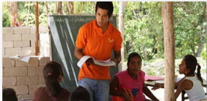
Clases en lengua indígena.

Dentro de las actividades iniciales el instructor realiza un diagnóstico lingüístico que le permite obtener un perfil individual y de grupo del uso de la lengua en sus alumnos. Es poco frecuente que los niños preescolares indígenas sean bilingües, por eso se privilegia el uso de la lengua materna y se apoya su consolidación en los aspectos