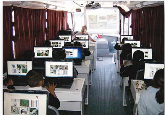
Unidades Móviles de Aprendizaje del IPN.