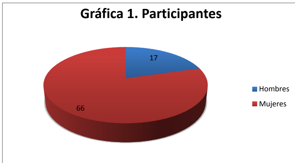
Gráfica 1. Participantes