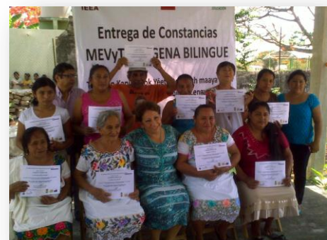
Entrega de constancias de las personas acreditadas en el modelo educativo del IEEA.

Para una mejor atención educativa a la población maya inmersa en las esferas del analfabetismo bajo el modelo de educación para la vida y el trabajo indígena bilingüe, se han determinado dos grandes áreas geográficas en nuestro Estado: Camino Real y Chenes, seleccionadas en función de sus características lingüísticas, culturales y de carácter estadístico por su alta presencia de oralidad en lengua maya y del rezago educativo.