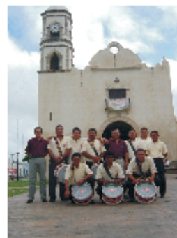
Banda de Guerra del F.U.T.V. visita al Cristo Negro de San Román, en septiembre del 2008.