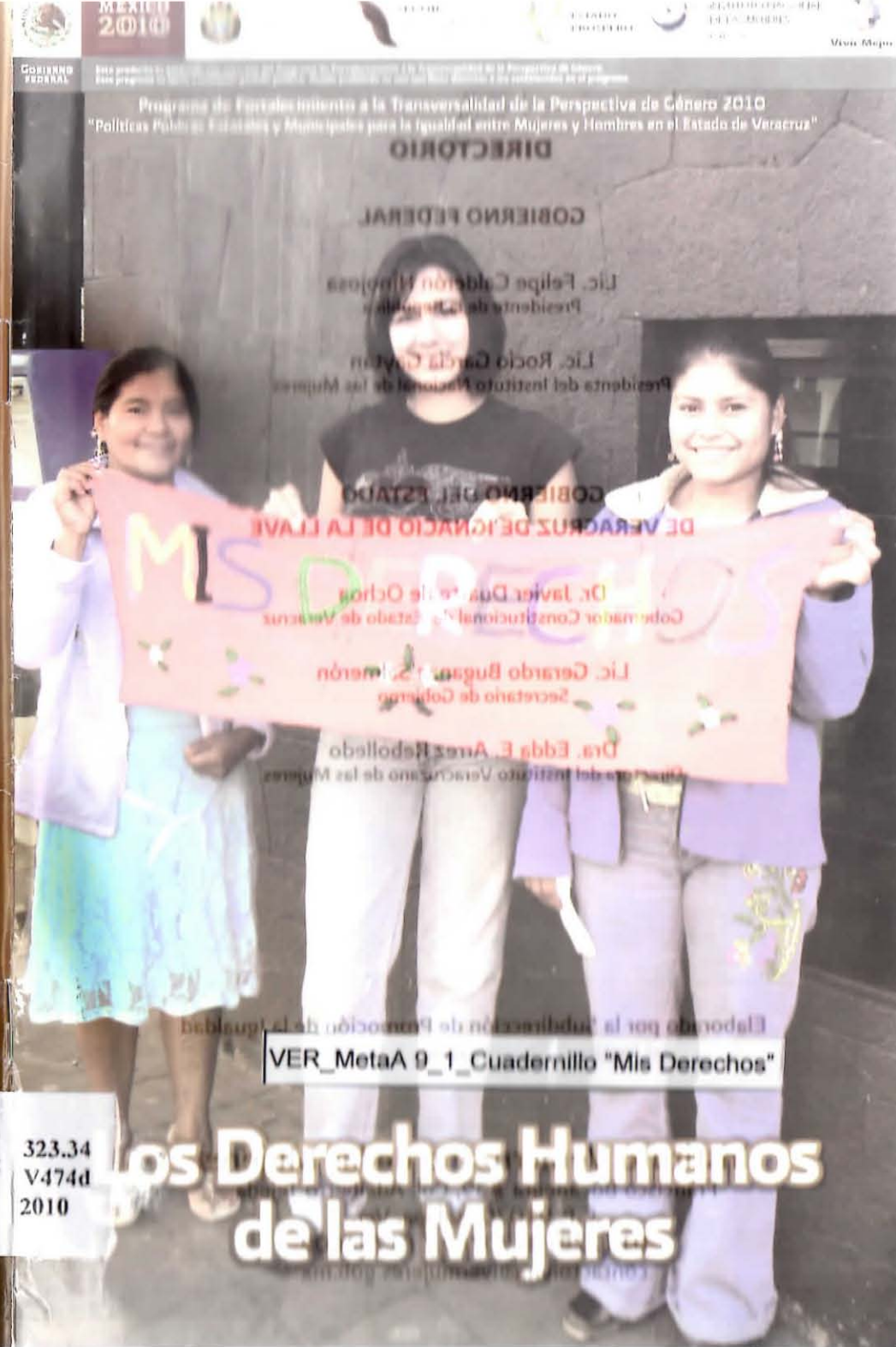
VER_MetaA 9_1_Cuadernillo "Mis Derechos"