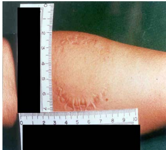
FIJACIÓN FOTOGRÁFICA CON TESTIGO MÉTRICO DE UNA MORDEDURA HUMANA LOCALIZADA EN UN CADÁVER DEL SEXO FEMENINO.

Además, se deberá solicitar la expedición del acta médica, documento que certifica la muerte de la víctima, misma que contiene la descripción del lugar en donde se practica la intervención, fecha, hora, situación y posición del cadáver, datos generales tales como edad, sexo, filiación, señas particulares, estudio antropométrico y descripción de lesiones al exterior entre otros datos de importancia.