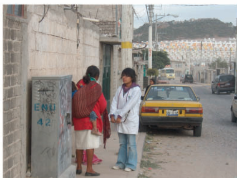
Mujer Otomí: el Rebozo

Los hombres han perdido totalmente su vestimenta original, la mujer usa falda de manta, blusa con encaje de tela floreada faja, quexquémel 21 , rebozo y morral bordado, esta vestimenta se puede observar en Santiago Mextititlán, sin embargo ya no en la Colonia Nueva Realidad. Algunas mujeres, especialmente las que tienen niños en brazos utilizan el rebozo.