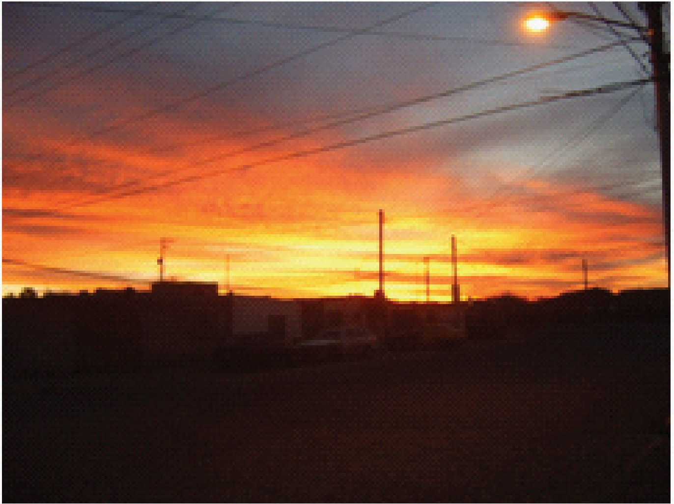
Un anochecer en la Nueva Realidad